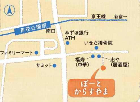
ぽーと からすやま