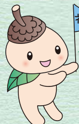
ココロン 世田谷区社協 キャラクター