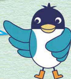
あんすこ君 あんしんすこやかセンター イメージキャラクター