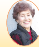
大和田編集委員 (上野毛町会)

コロナ終息に向かいつつありますが、まだまだ気を緩めることなく今まで通り密をさけ、部屋の換気、手指消毒、マスク着用などの基本的な生活習慣を心がけていくことが大切ですね。体力維持のため、室内でできる足踏みやスクワットなどの軽い運動を取り入れるのも良いですね。コロナに負けることなく元気で生活しましょう。