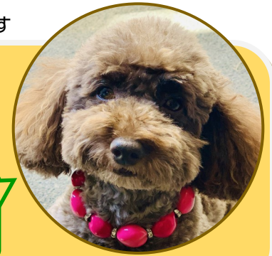
セラピー犬 ポリーちゃん 中町4・5丁目町会の防犯活動「緑のレンジャー」のお手伝いもします