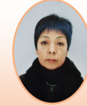
村井編集委員 (上野毛町会)

コロナ終息に向かいつつありますが、まだまだ気を緩めることなく今まで通り密をさけ、部屋の換気、手指消毒、マスク着用などの基本的な生活習慣を心がけていくことが大切ですね。体力維持のため、室内でできる足踏みやスクワットなどの軽い運動を取り入れるのも良いですね。コロナに負けることなく元気で生活しましょう。