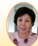
鶴岡編集委員 (中町4・5丁目町会)

おうち時間で愛犬ポリーと芸の練習をしています。ポリーは介護施設で利用者の方と触れ合っていますが、コロナ禍でもう1年以上活動休止なので、この時間を利用してハードル飛び、輪くぐり、ドッグダンスなどをマスターして皆さんにお披露目する日を楽しみにしています。