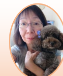
稲葉編集委員 (中町4・5丁目町会)

『お天気が良いと気持ちがいいわ。』とか、『寒い日はジャキツとなるわ。』とか、『スーパーで買い物して、いつの間にかポイントが貯まったわ。』とか、ちょっとしたことで楽しく過ごしましょう。