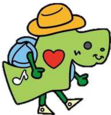
経堂地区キャラクター お経ちゃん

経堂地区身近なまちづくり推進協議会とは… 「住みよいまち経堂・宮坂・桜丘」の実現に向けて、 区民と区が協力しながら自主的なまちづくりを行っ ています。