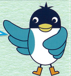
あんすこ君 あんしんすこやかセンター イメージキャラクター

社会福祉士、主任ケアマネジャー、保健師等がご相談に応じます。ご自身、ご家族、近隣の方など、どなたでもご相談いただけます。