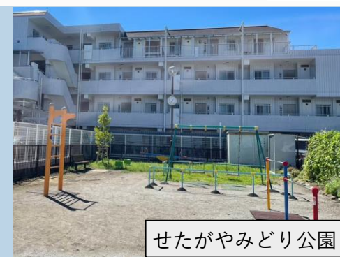
せたがやみどり公園