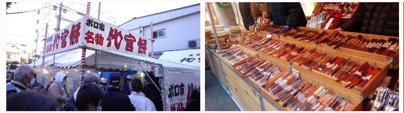
▶ 昨年のボロ市のようす。くす玉開き(上)、名物の代官餅(左下)と、出店(右下)。