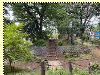
世田谷城址公園 土塁と空堀

上町の逸話(五) 松陰神社、勝国寺をお参りして、目的地の世田谷城址公園で一時を過ごしてきました。自宅からドア・トゥー・ドアで三・六キロメートル、公園で休憩した時間を入れて一・五時間、有意義な世田谷の史跡巡りのコースでした。勝国寺は、いつもは非公開の薬師如来立像(世田谷区指定有形文化財)を以前に参拝させていただいたことやこの地に世田谷城の物見櫓があったと聞いた覚えもあって、今回きれいに掃き清められた境内を歩き、薬師堂の西方にある豪徳寺のひと際高く生い茂った樹木を眺めるだけにしました。世田谷城は、赤穂浪士の討入りで有名な吉良上野介と祖を同じくする吉良治家が一四世紀後半に築城してから、二百数十年間に亘る世田谷吉良氏八代の館だったそうです。豊臣秀吉の北条攻めの際、一五九〇年に北条氏とともに世田谷吉良氏は滅亡し、徳川家康が関東に領地替えになったときに廃城となりました。今日では、その跡地が城址公園として整備され、世田谷百景にも選ばれて区民の癒しの場となっています。住宅街の中に、鬱蒼とした樹木に覆われた豊かな自然と中世に舞戻ったかのような四百年前の土塁が整然と積みあがっている様子を見たことは、この日の目当てにしていただけに、久しぶりに至福の時間を過ごすことができました。世田谷区は広く、観光スポットが豊富にあります。ウォーキングの目的地にはこれからも全く困りません。(弦巻町会 M・A)