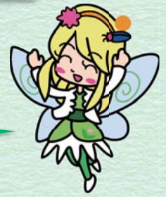
わかゆちゃん 若林地区キャラクター