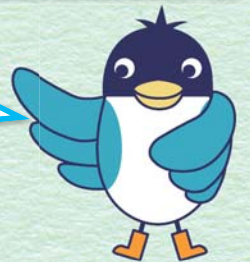
あんすこ君 あんしんすこやかセンター イメージキャラクター