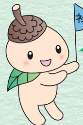
ココロン 世田谷区社協 キャラクター

社会福祉協議会は、誰もが地域で安心して住み続けられるよう住民の皆さまと共に、福祉のまちづくりを進めています。