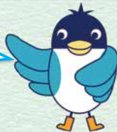
あんすこ君 あんしんすこやかセンター イメージキャラクター