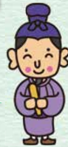
太子丸 太子堂地区キャラクター