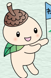
ココロン 世田谷区社協 キャラクター