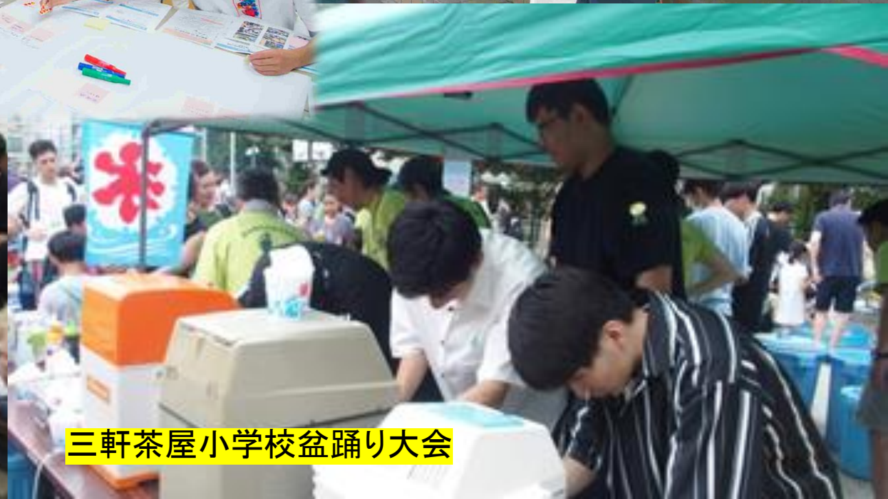
三軒茶屋小学校盆踊り大会