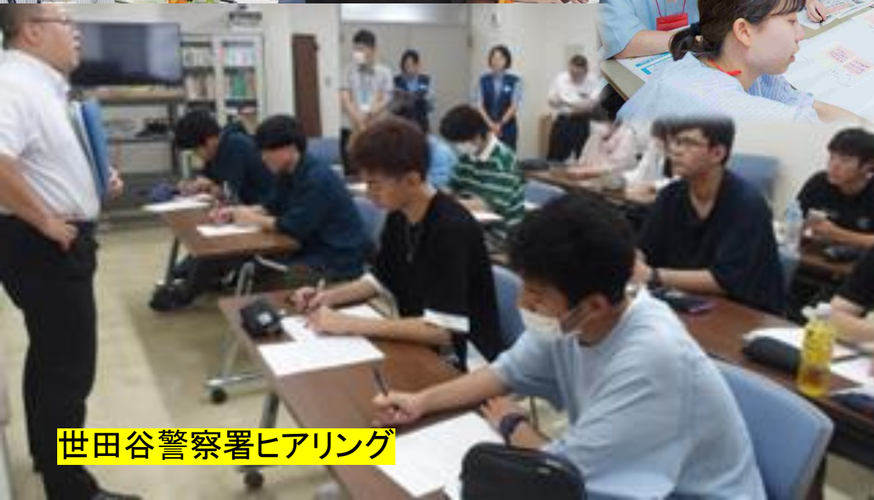
世田谷警察署ヒアリング