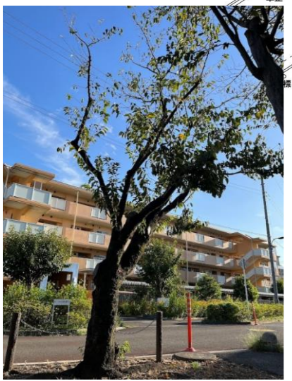
現在の区道沿いの桜

※その他 ・ベンチは遊具や植栽などの設置位置に応じて再設置、更新します。 ・公園灯は老朽化しているため、LEDの公園灯に更新します。 ・劣化している舗装は改修します。