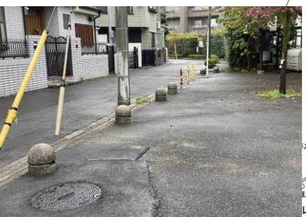
現況の西側エントランス部