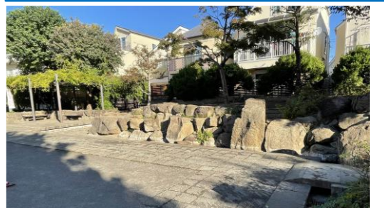
既設石積・パーゴラ

石積み・パーゴラ 本公園の特徴である石積みやパーゴラをいかした改修を検討します。