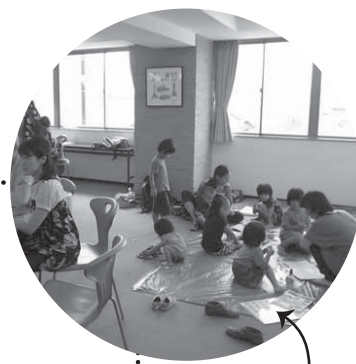
お母さんの傍らで遊ぶ子どもたち