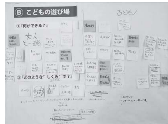
検討作業をした模造紙