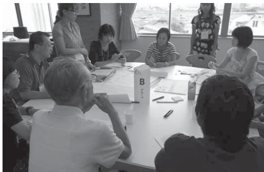
グループ検討会の様子

次に、3つのグループに分かれ、公園の維持・管理で、自分たちで何ができるのかを、具体的な運営方法を踏まえて、意見交換・検討をおこないました。