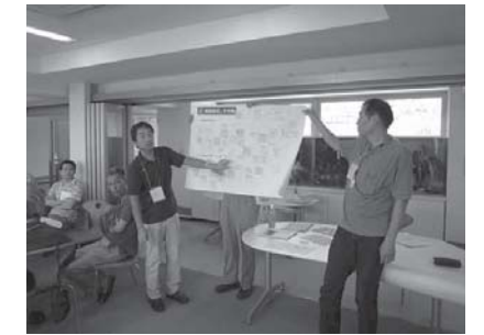
まとめの発表会の様子