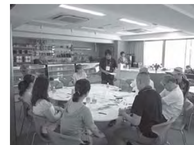
<ワークショップの様子>