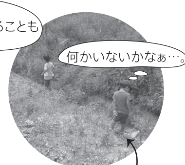
帰り道、子どもたち...