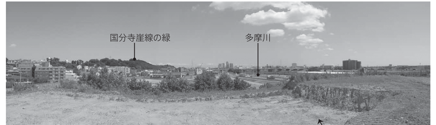
現在の公園計画地の様子

平成25年春の公園の一部開園に向けてさらにステップは続きます。 区は、みなさんの活動を応援していきます!