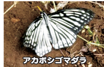
アカボシゴマダラ

今年全体で422種もの生きものが報告されています。この中に外来種の報告もありました。外来種という悪いイメージがありますが、そもそも人に連れてこられた生きものたちです。よく見かけるアカボシゴマダラやワカケホンセイインコに加え、世田谷区でほとんど記録のない昆虫類のクズクビソハムシやヘリチャハゴロモなどが報告されていました。また植物のコカラスムギなど、じっくり観察しないと区別できない種類も含まれています。世田谷の生きもの、緑地のことを考えるとき、この外来種はとて気になるからこそ報告して頂いたのかと思います。外来種のことを知ることははじめ、新しい対策や付き合い方のヒントを探していきましょう。