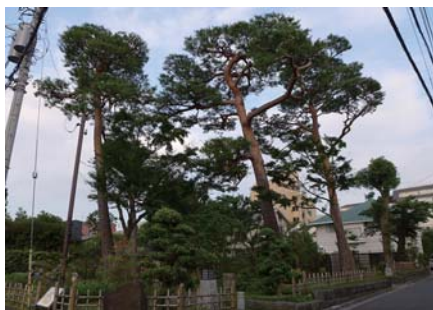
1 アカマツ 区立桜新町一丁目緑地 桜新町 1-31 樹形の美しいアカマツが並んでいます。

< 開館時間 > 10 時～17 時 30 分 (受付締切 16 時 30 分) < 休館日 > 月曜日等 < 入館料 > 一般 900 円 中学生・小学生 400 円 等