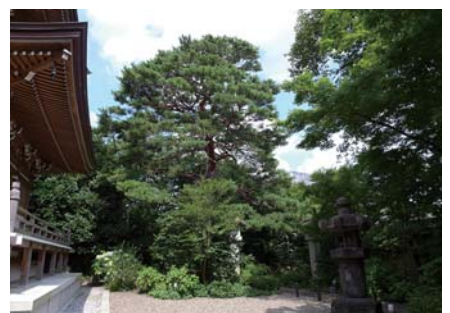
7 アカマツ 実相院 弦巻 3-29 樹形も幹も美しい木です。駒留通り沿いの駐車場からも見えます。