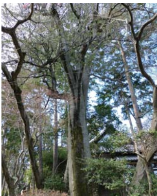
3 モッコク 豪徳寺 豪徳寺 2-24 モッコクの木としてはとても大きく、10mを超えています。