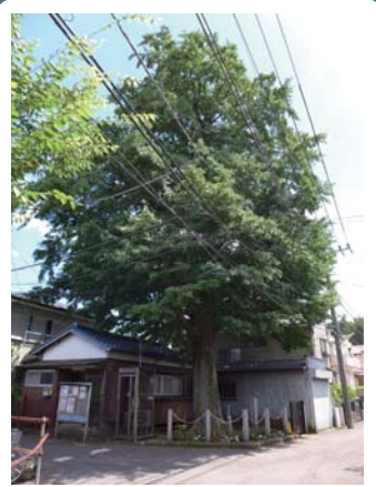
3 喜多見小学校発祥地のイチョウ 喜多見 4-13 喜多見中部町会集会所の横にあります。