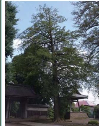
5 カヤ 慶元寺 喜多見 4-17 昔はたくさん実がなって、種子から油を絞ったそうです。