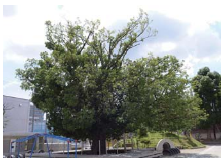
5 アカガシ (オオアカガシ) 区立桜小学校 世田谷 2-4 東京都の天然記念物に指定されています。学校の西側の通りから見えます。