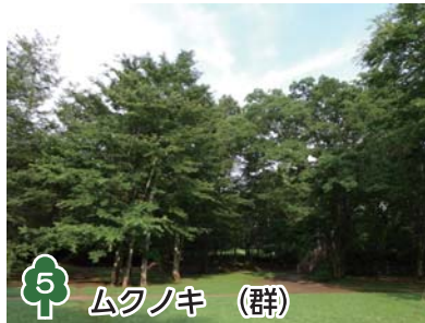
5 ムクノキ (群)