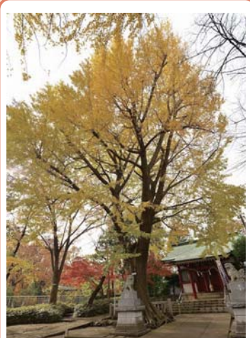
2 イチョウ 粕谷八幡神社 粕谷 1-23 秋には境内のモミジとともに紅葉の共演が楽しめます。