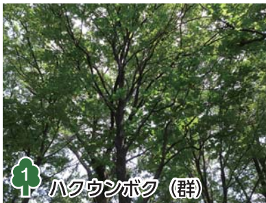
1 ハクウンボク (群)