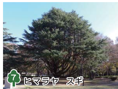
7 ヒマラヤ スギ