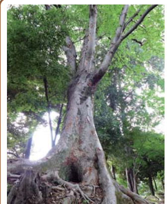
2 ケヤキ 豪徳寺 豪徳寺 2-24 本堂西側の斜面地に力強く根を張っています。(接近不可)