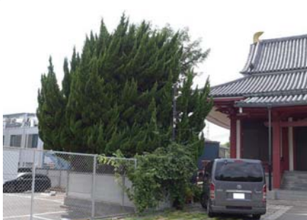
4 カイツカイブキ 医王寺 深沢 6-14 葉が波打つような形になるのが特徴の木ですが、丸く剪定されている時もあります。