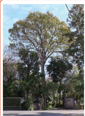
1 ケヤキ 個人宅 粕谷 2-11 名木の中では3番目に高く、枝張りも見事です。

★ 2 希望丘公園 球戯広場、壁泉広場、児童遊具などの施設があり、大人から子供まで楽しめる魅力溢れる公園です。