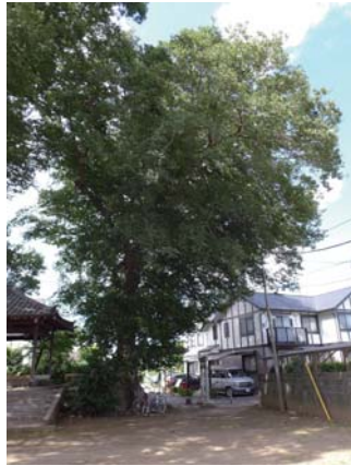
2 ムクノキ 須賀神社 喜多見 4-3 階段を巻き込むように根を張っています。