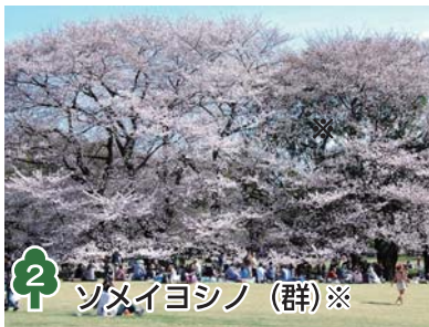
2 ソメイヨシノ (群)※