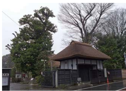
6 タブノキ 世田谷代官屋敷 世田谷 1-29 代官屋敷の茅葺きの長屋門とともに歴史を感じさせます。