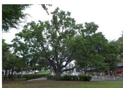
6 コブシ 都立駒沢 オリンピック公園 駒沢公園 1-1 コブシとしては珍しく横に大きく広がった樹形の木です。