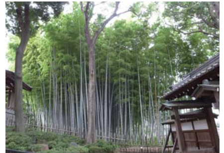
4 モウソウチク(群) 勝光院 桜 1-26 手入れのよい美しい竹林です。まとまった面積の竹林は区内では貴重です。