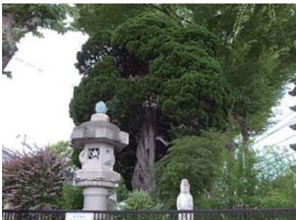
1 シンパク (イブキ) 個人宅 喜多見 7-25 区内では珍しい木です。