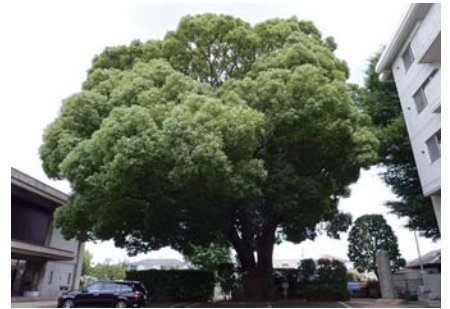
1 クスノキ 乗泉寺世田谷別院 宮坂 2-1 幹周 628cm と名木の中でも、3 番目に太い木です。樹冠も大きく広がり立派です。

世田谷区随一の「歴史公園」で昔のおもかげを残す土塁などがあります。さざ草伝説の「常盤姫」が住んでいました。