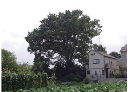
5 ケヤキ 個人宅 新町 1-16 畑のあるのどかな 風景にある大きく 枝を広げた立派な ケヤキです。