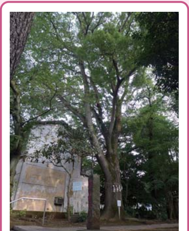
1 クスノキ 世田谷山観音寺 下馬 4-9 高さ20mを超える樹形も美しい木です。葉を揉むと樟脳(しょうのう)の香りがします。

★ 区立世田谷公園 キンカン 広々とした園内には噴水を中心として、スポーツ施設、交通広場、プレーパーク等があります。また、休日には「せたがや公園キンカン三姉妹ミニSL」が走ります。