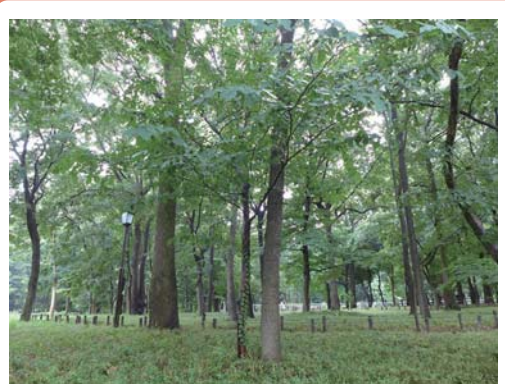
3 コナラ・クヌギ (雑木林) 都立蘆花恒春園 粕谷 1-20 文豪徳富蘆花が明治40年に夫人と共に移り住み、田園生活を楽しんだ雑木林です。