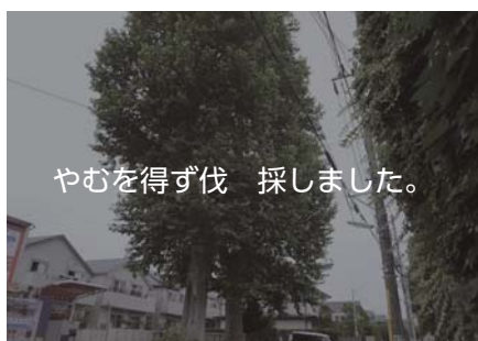
やむを得ず伐 採しました。 2 モミジバスズカケノキ 民間駐車場 深沢 7-22 名木の中で高さ 第 4 位の大きな木 で樹皮の模様が きれいです。