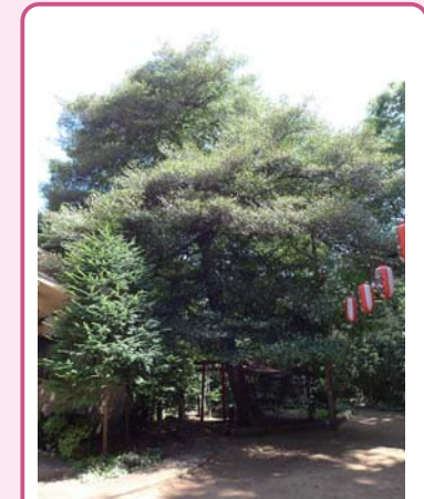
3 モッコク 駒繫神社 下馬 4-27 モッコクとしては大きな木です。葉の付け根が赤くなるのが特徴です。