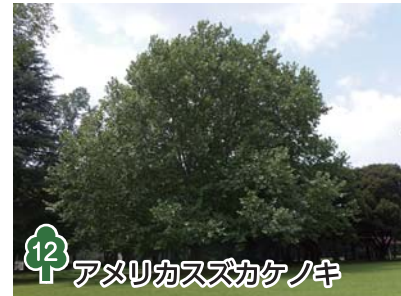
12 アメリカスズカケノキ