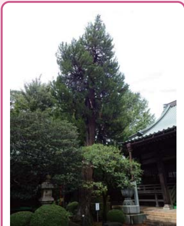
2 コウヤマキ 西澄寺 下馬 2-11 高さ20mを超す大木で、これほど大きなコウヤマキは区内では珍しいです。