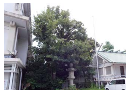
3 ボダイジュ 深沢神社 深沢 5-11 中国原産の木です。ボダイジュの木として は大きく 10m を超えています。