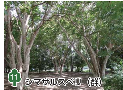
11 シマサルスベリ (群)