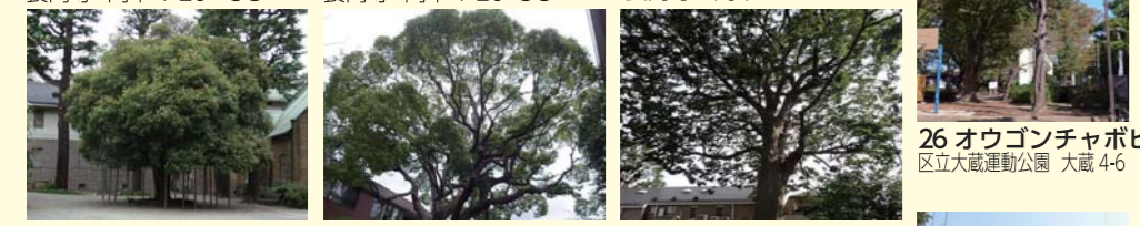
登天3 ギンモクセイ 静嘉堂 文庫美術館 岡本 2-23 3C 36 クスノキ 多摩川テラス 岡本 1-3 3C 49 ケヤキ 区立瀨田二丁目 けやき公園 瀨田 2-9 3C