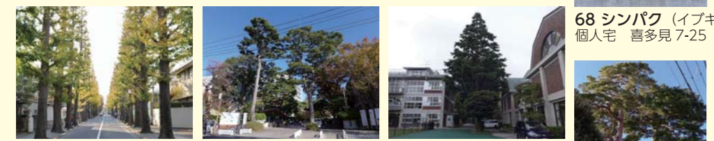
68 シンパク (イブキ) 個人宅 喜多見 7-25 3B 17 イチョウ (並木) 成城学 園正門前の街路樹 成城 6-1 3B 43 クロマツ 成城学園 成城 6-1 3B 85 ヒマラヤスギ 成城学園 成城 6-1 3B