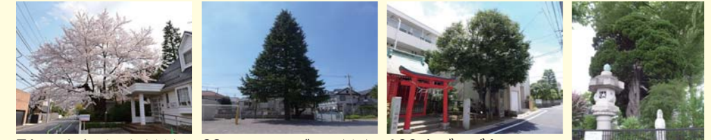
71 ソメイヨシノ 小川小 児科医院 成城 4-4 3A 83 ヒマラヤスギ 区立祖師 谷小学校 祖師谷 3-49 2B 100 ヤブツバキ 稲荷神社 砧 6-3 2B