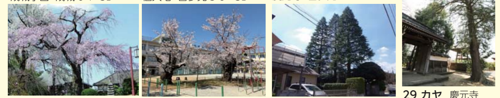
66 シダレザクラ (群) 妙法寺 大蔵 5-12 3B 72 ソメイヨシノ 区立砧小学校 喜多見 6-9 3B 84 ヒマラヤスギ 成城三丁目 成城 3-6 3B 29 カヤ 慶元寺 喜多見 4-17 4B