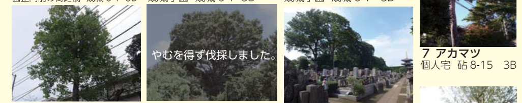
105 ユリノキ 成城学園 成城 6-1 3B 52 ケヤキ 個人宅 喜多見 3-8 3B 指天2 ケヤキ (群) 慶元寺 喜多見 4-17 3B