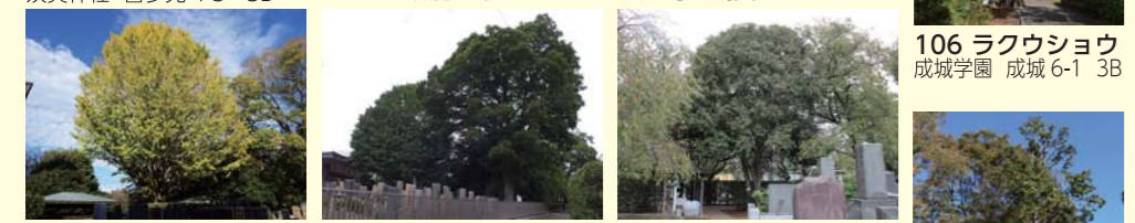
18 イチョウ 長円寺 岡本 1-20 3C 25 エノキ 長円寺 岡本 1-20 3C 31 キンモクセイ 長円寺 岡本 1-20 3C