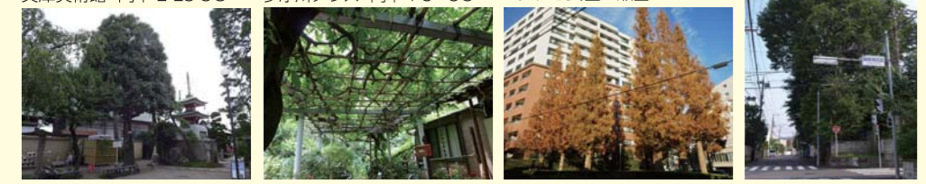
78 タラヨウ 慈眼寺 瀨田 4-10 3C 87 フジ 個人宅 大蔵 1-9 3C 91 メタセコイア (並木) ラ・コルダ茗茶 茗茶 5-1 3C 50 ケヤキ 稲荷神社 瀨田 4-32 3C