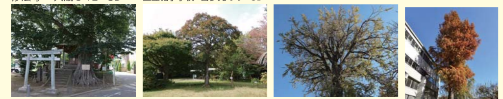
89 ムクノキ 須賀神社 喜多見 4-3 3B 37 クロガネモチ 区立桜丘 すみれ自然庭園 桜丘 4-23 2C 16 イチョウ 無量寺 用賀 4-20 3C