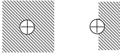
図根多角点等標識の周りの舗装打換の時 (標識に接しない時も同様とする)