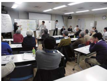
『提案書』（案）の確認と共有の様子

平成26年11月から約1年半にわたり、延べ12回開催してきました下北沢駅周辺都市計画道路（補助第54号線及び世区街第10号線）整備ワークショップは、今回をもちまして終了しました。