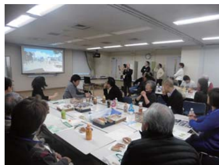
道路整備後のイメージ映像上映の様子