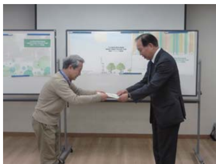
世田谷区への提出の様子