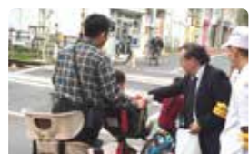
自転車安全利用推進員の活動例 (芦花公園踏切押し歩きキャンペーン)