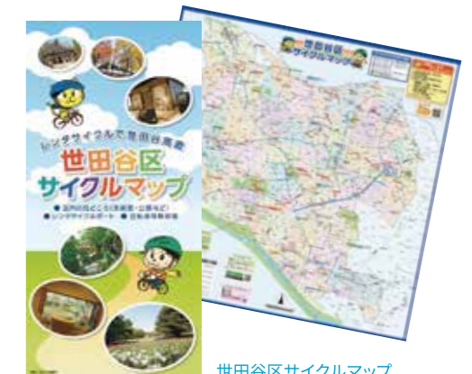
世田谷区サイクルマップ