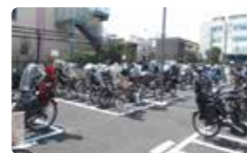
大型自転車専用スペースの設置 (桜新町自転車等駐輪場)