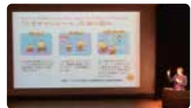
保護者対象の出前型自転車安全講習