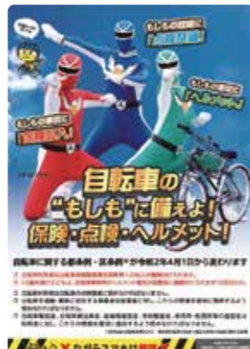
区自転車条例改正PRちらし