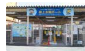
コミュニティサイクルポート (桜上水駅)