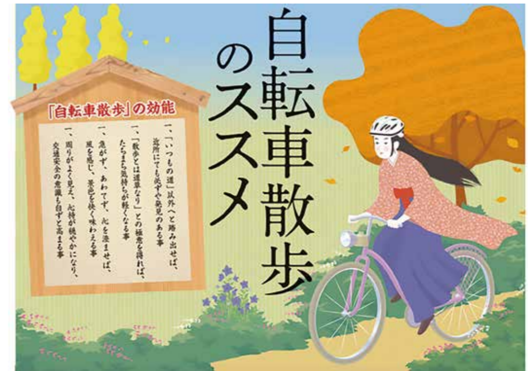
自転車散歩のススメ（区のお知らせ 令和2年10月15日号より抜粋）

このため、自転車利用者に率先行動を呼びかけるとともに、行政は区民・事業者と協働して、そのための環境整備を進める等、双方向からの取組みが必要です。それを表現したのが前ページの4つの基本方針です。