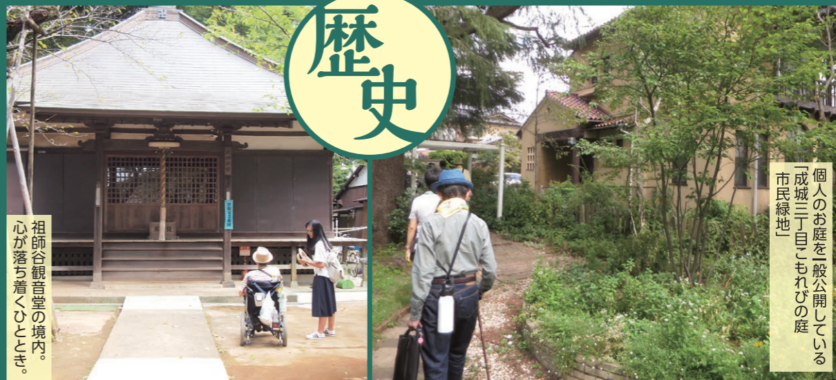
祖師谷観音堂の境内。心が落ち着くひととき。