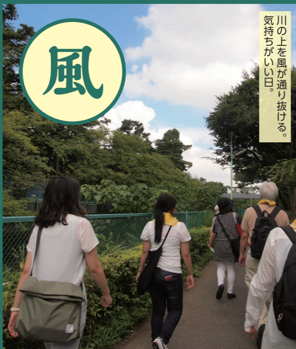
川の上を風が通り抜ける。気持ちがいい日。