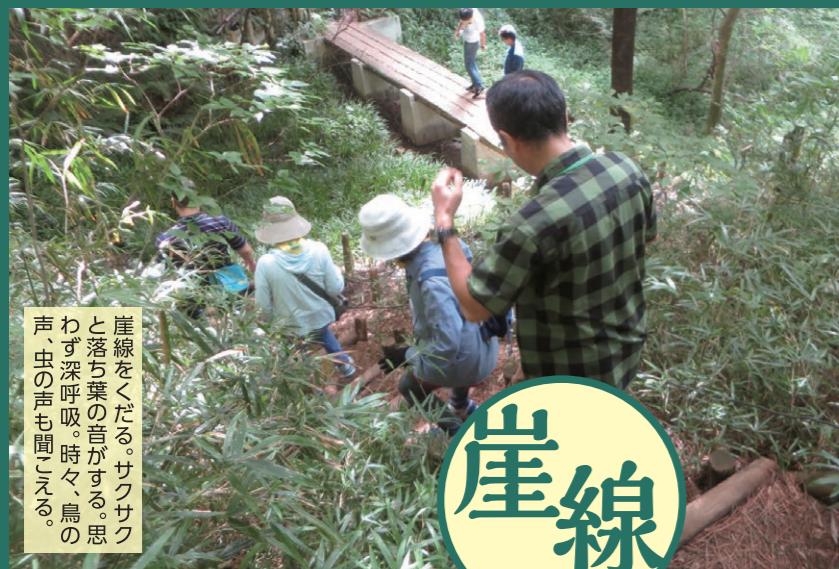
崖線をくだる。サクサクと落ち葉の音がする。思わず深呼吸。時々、鳥の声、虫の声も聞こえる。