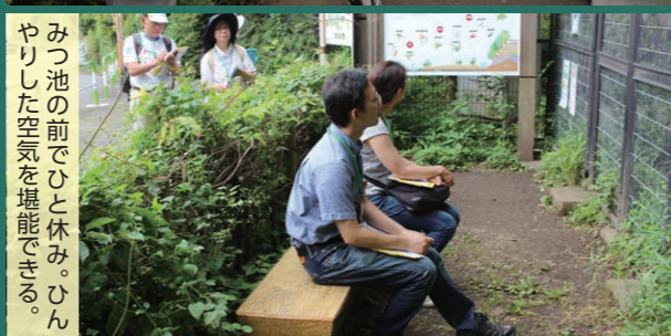
みつ池の前でひと休み。ひんやりした空気を堪能できる。