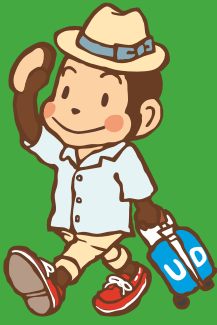
世田谷区 ユニバーサルデザイン 普及啓発キャラクター "せたっち"