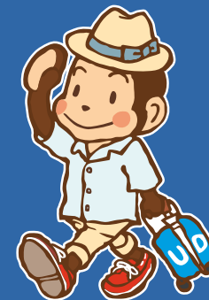
世田谷区 ユニバーサルデザイン 普及啓発キャラクター "せたち"

このモデルコースは、ユニバーサルデザインの視点で多くの人々がまちを楽しく散策するために、区民参加で実際に歩いて作成したものです。