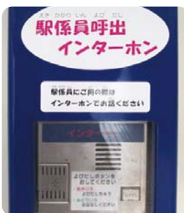
駅のインターホン