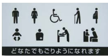
どなたでもごりようになれます トイレのピクトサイン