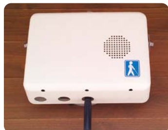
公園トイレの音声案内装置

文字や図だけでなく、耳 で聞き取る音声案内も有 効です。複数の方法で情 報を伝えることがUDに つながる。