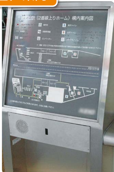
音声・点字の付いた構内案内板 （千歳烏山駅）