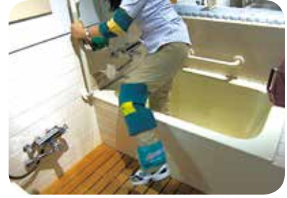
※人にやさしい住まいづくり体験館（ハウスクエア横浜）での見学会