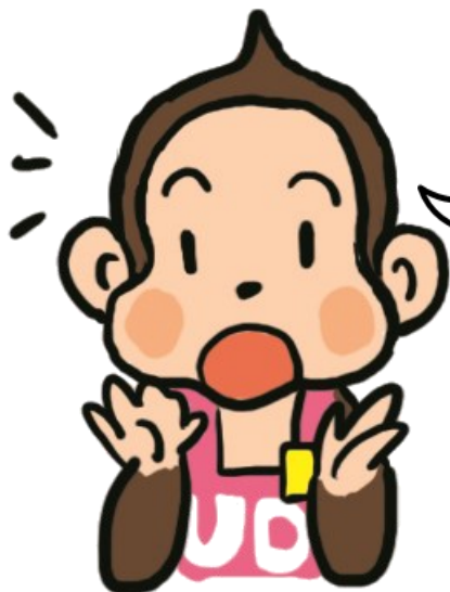
ユニバーサルデザイン普及啓発キャラクター “せたっち”