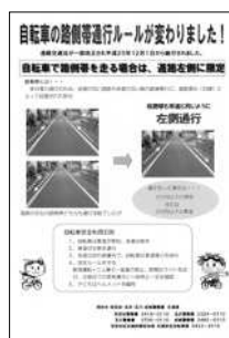
自転車の新しい通行ルールの普及ポスター