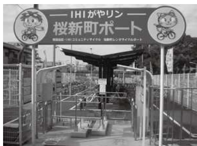
区立の自転車駐輪場整備の事例