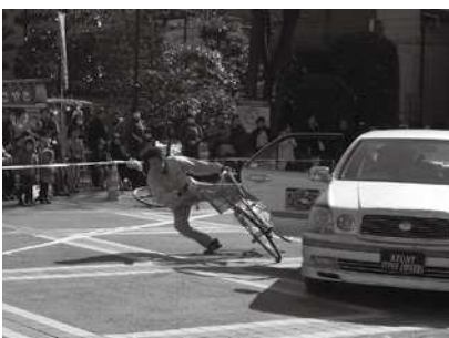
スタントマンによる安全運転の啓発