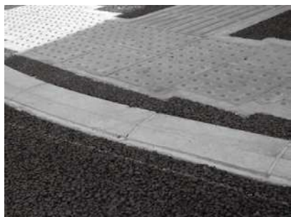
整備された歩道の出入口部分