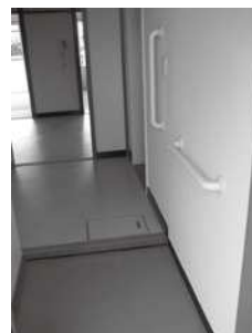
住宅改修後の玄関の様子