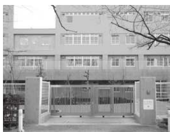
改築した小学校の様子