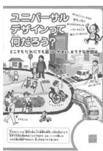
ユニバーサルデザイン・ハンドブックの表紙