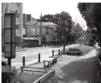
歩道上のベンチの整備事例