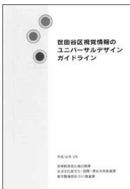
視覚情報の ユニバーサルデザイン ガイドライン (平成 18 年発行)