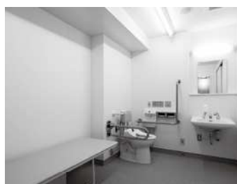
小学校内の車いす使用者用便房の様子