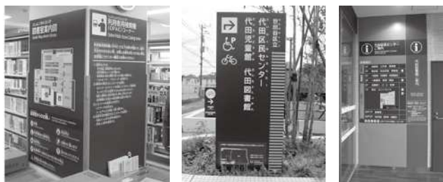
代田区民センターのユニバーサルデザインによるサイン（3点とも）