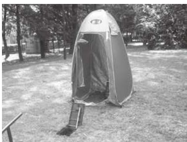
公園内のマンホールトイレ