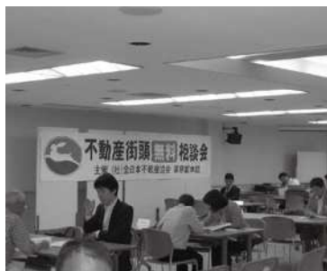
住宅相談会の会場の様子 (2点)