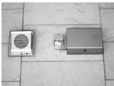
音声案内装置の整備事例