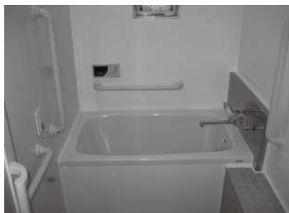
住宅改修後の浴室の様子