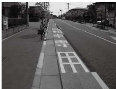
① 自転車専用通行帯