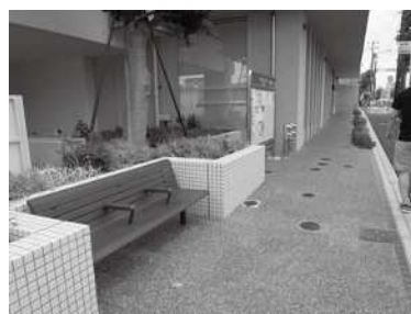
区立施設の敷地内にベンチを整備した事例