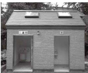
公衆トイレの整備事例