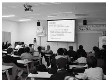
ユニバーサルデザインフォーラムの様子