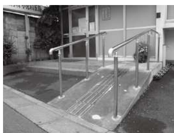
段差解消のスロープを整備した事例