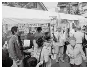
商店街のイベントでの普及啓発の様子