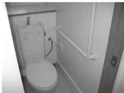
住宅改修後のトイレの様子