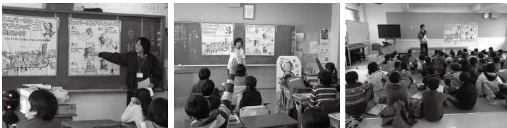
小学校での、ユニバーサルデザイン出張講座の様子（3点とも）