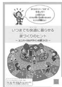
住宅相談会で配布した啓発冊子