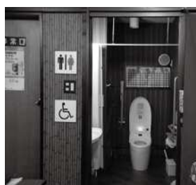
車いすでも使えるトイレを整備した飲食店の事例