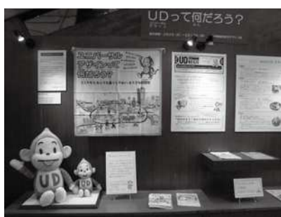
ユニバーサルデザインの普及展示コーナーの様子