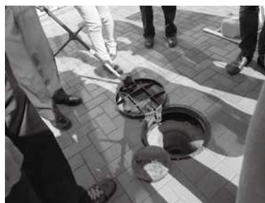
区立施設内のマンホールトイレ