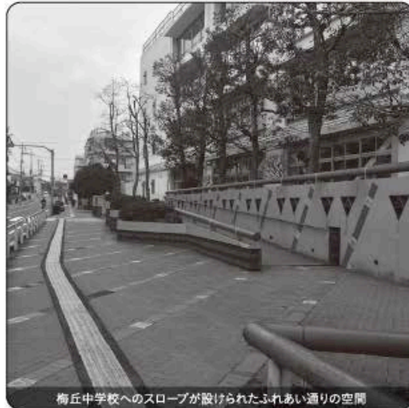
梅ヶ丘中学校へのスロープが設けられたふれあい通りの空間

小田急線梅ヶ丘駅周辺では昭和57年から「参加と福祉」の視点によるまちづくりが進められています。昭和62年からは「やさしいまちづくり」として、計画段階から住民と区が話し合い、梅ヶ丘中学校や光明養護学校の前を「ふれあい通り」と呼び、「電柱などを整理する」「通行できる幅を広く確保する」「段差をなくす」「楽しく歩けるように色彩や形状をデザインする」という、誰もが安全で快適に歩ける歩道づくりが提案されました。