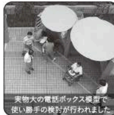
実物大の電話ボックス模型で使い勝手の検討が行われました

まちへの具体的な反映にあたっては、車イスのまま入ることのできる電話ボックスの実物大模型を作り、使い勝手を検証する公開実験を行ったり、地域の学校とのコラボレーションで作った草花タイルやサギ草