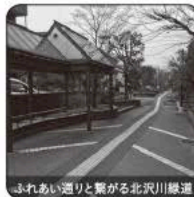
ふれあい通りと繋がる北沢川緑道

時代の流れから、電話ボックスの公衆電話が撤去される等の変化はありますが、「やさしいまちづくり」の考え方は、豪徳寺駅や山下駅へと広がり、多くの方が暮らしやすいまちづくりとして、将来にわたり続いていきます。