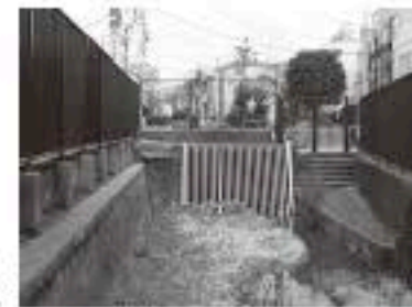
写真右手の階段辺りに取水口がありました

下流域が市街化し、灌漑用水としての使命が終わった後は、現在の恵比寿にあるエビスビール工場の用水等に使用されていました。戦後には利用が減少し廃止されました。