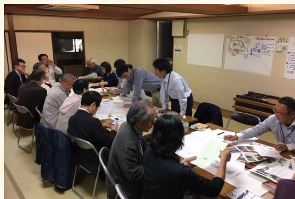
検討会の様子（奥沢交和会館）

平成29年度からは世田谷区都市デザイン課協力のもと、奥沢の魅力的な風景を守り育てる手立てとして「界わい形成地区」の指定に向けて検討を進める取組みを行っています。