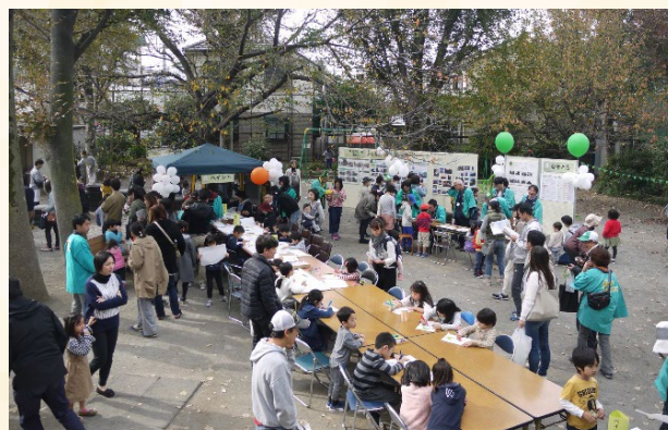
風景祭（平成30年 奥沢公園）