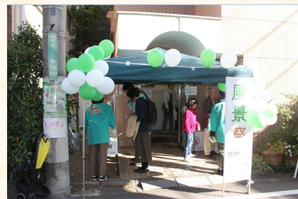
風景祭（令和元年 奥沢交和会館）