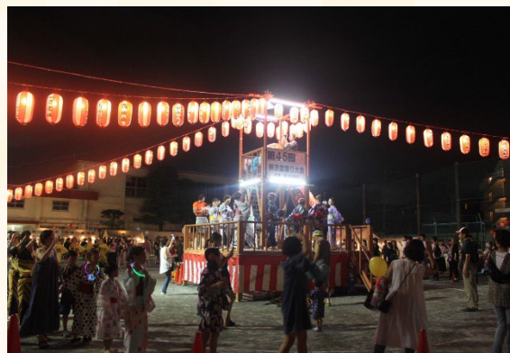
盆踊り大会（奥沢小学校）