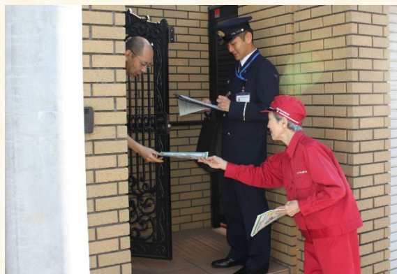
防火診断で家庭に訪問