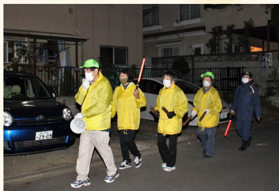
毎年歳末警戒を実施