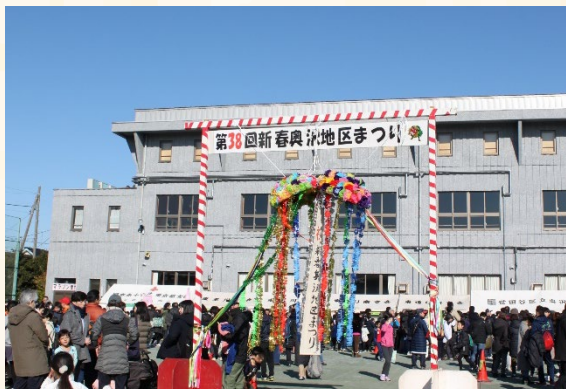
新春奥沢地区まつり（奥沢中学校）