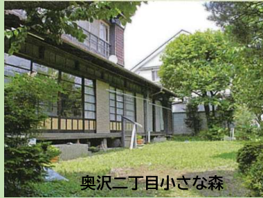
奥沢二丁目小さな森