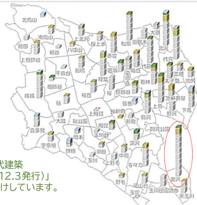
【図3】近代建築現存数 (平成23年3月現在)