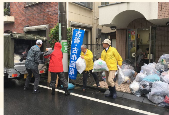
定期的に古布回収