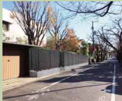
建物の色彩の配慮