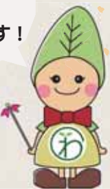
おくさ「わ」風景キャラクター わっこちゃん