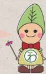
おくさわ風景キャラクター わっこちゃん