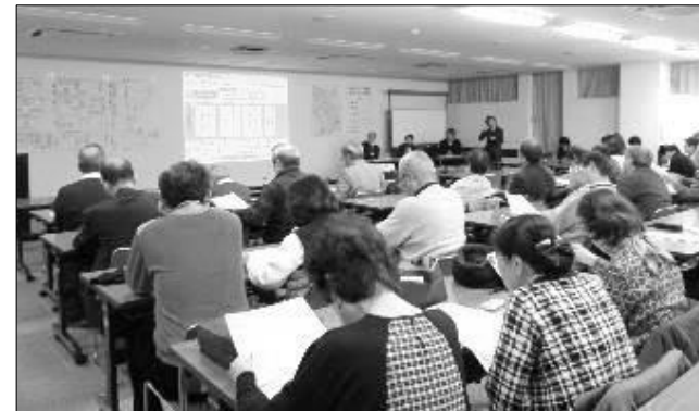
第1回街づくり意見交換会の様子

※ 世田谷区トップページ▶目次から探す▶住まい・街づくり・環境▶街づくり▶烏山総合支所管内の街づくり▶北烏山二・三丁目地区(烏山北住宅・烏山松葉通住宅)の街づくり