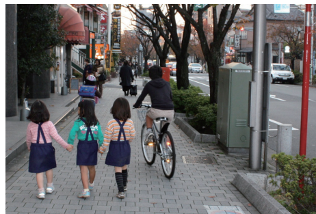
だれにでも使いやすく安全なまちに