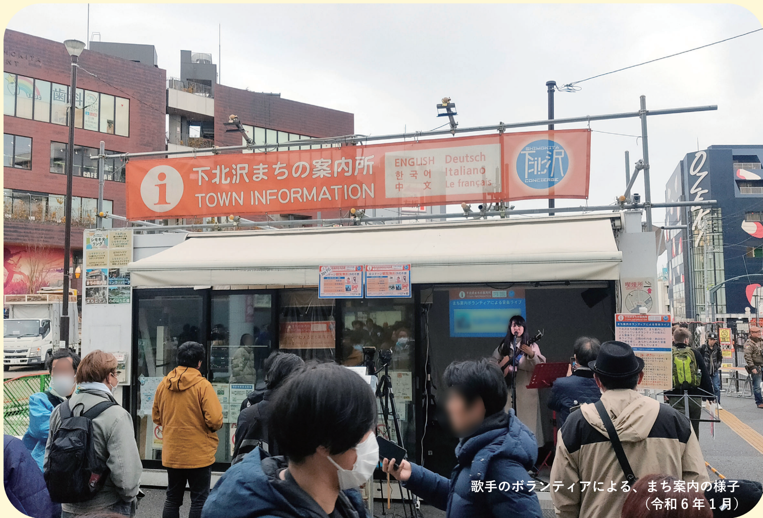
歌手のボランティアによる、まち案内の様子 (令和6年1月)