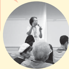
参加者からの提案