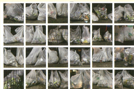
下北沢駅前広場で回収されたごみの様子 夏季は1晩に2～3袋のごみが捨てられていた。