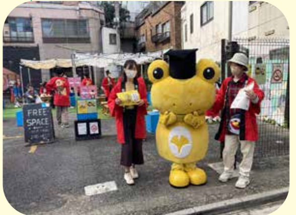
東京大学駒場祭とのコラボレーション (令和4年11月)

だれもが自由に座れる青い椅子を置くことで、街に憩いの場をつくる活動を令和元年度から行っています。今年度も地域イベントや周辺の大学とも連携しながら、定期的開催しています。