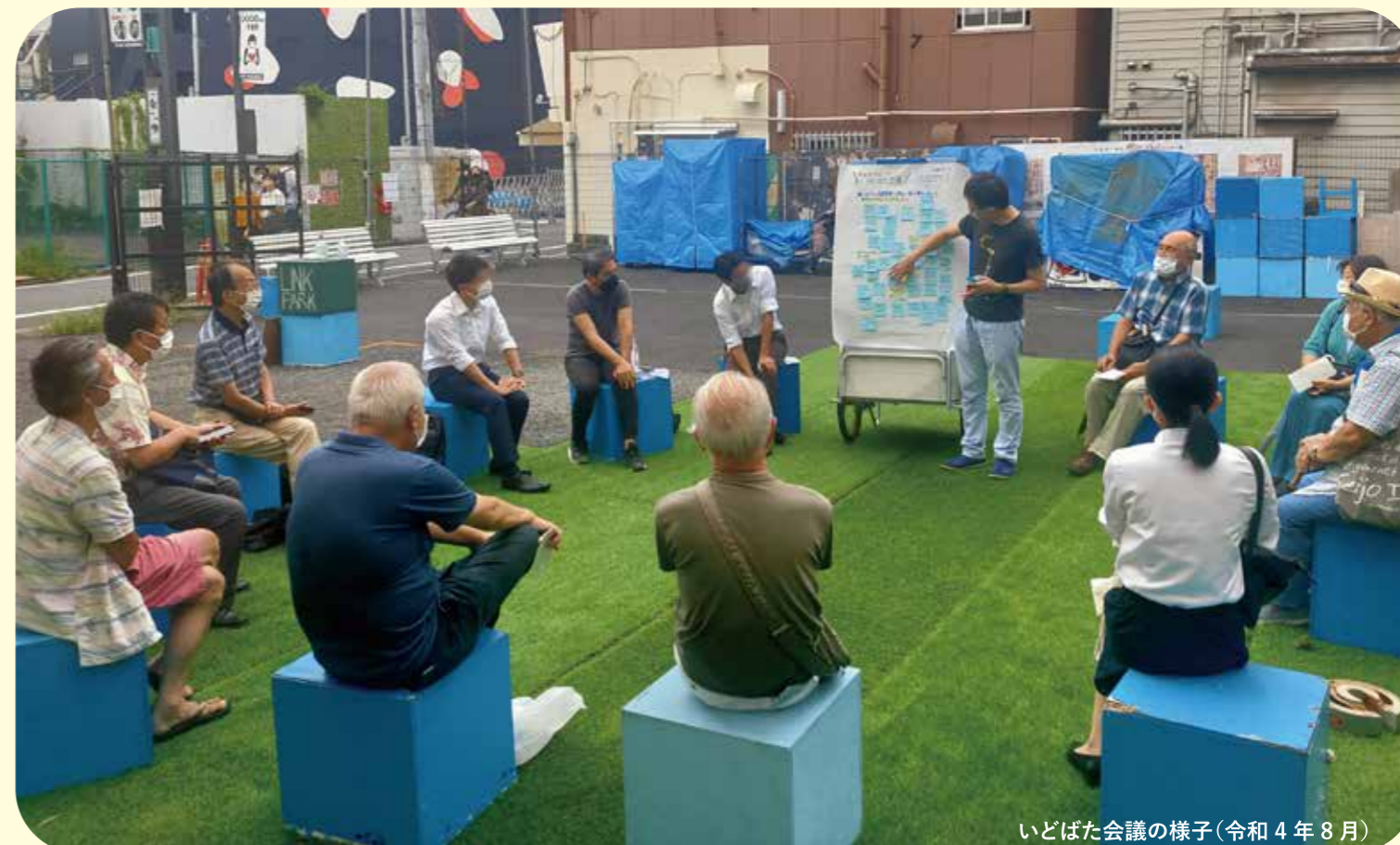
いどばた会議の様子(令和4年8月)

令和4年度より下北沢リンク・パークで、いまの、そしてこれからの、シモキタについて考え、共有する「シモキタリングいどばた会議」がスタートしました。▶詳しくは4ページ