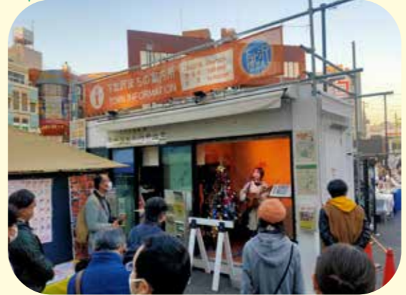
歌手のボランティアによるまち案内の様子 (令和4年12月)