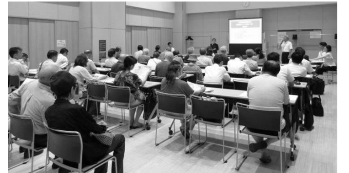
◇地区街づくり計画(案)説明会の様子

このたび、世田谷区街づくり条例による公告・縦覧を経て、『代田橋駅周辺地区 地区街づくり計画』を決定しますのでお知らせいたします。