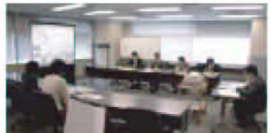
応募アイデア確認(ヒアリング)の様子

ご応募いただいた区民アイデアの中で、さらに内容の確認が必要と判断した22件について、委員会による応募アイデアの確認(ヒアリング)を平成21年1月末に行いました。