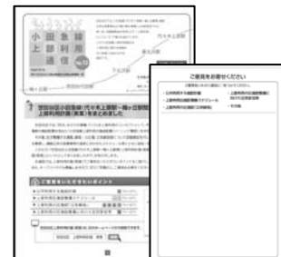
【上部利用通信 N o. 10】