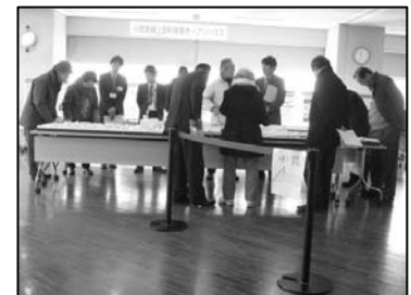
【オープンハウス当日写真】