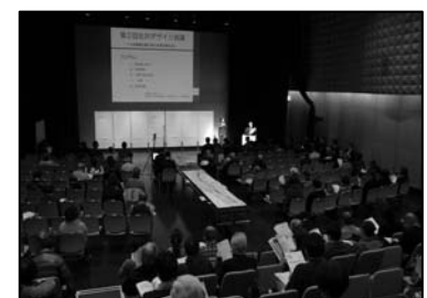
【第 2 回北沢デザイン会議当日写真】