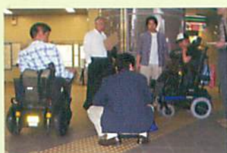
舗装、点字ブロックの実際の施工例を検証しました。