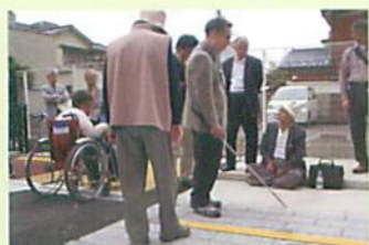
テスト道路を作り、実際に車椅子利用者視覚障がいの方に検証してもらいました。