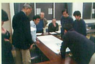
協議会では道路部会を設置し、やさしい道路について検討を重ねました。