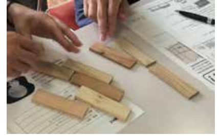
家具の側面に貼っていく

A 慣れれば数分でできる。面取りカンナでも良いが、子どもはサンドペーパーでもできる。