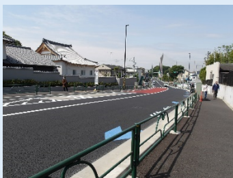
令和5年4月に一部交通開放