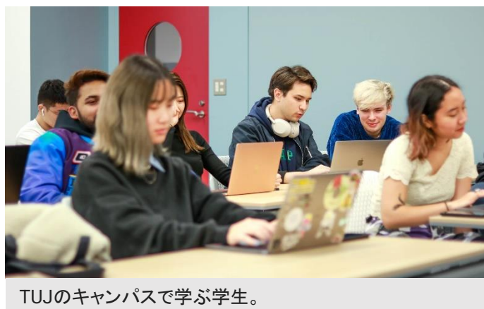
TUJのキャンパスで学ぶ学生。

TUJは今年9月から始まった秋学期より、観光・ホスピタリティマネジメント学科を開設しました。テンプル大学米国本校ですでに存在する本学科は、2022年「世界大学学術ランキング」の学科別順位で7位となるなど世界的に高い評価を得ています。TUJにおける観光・ホスピタリティマネジメント学科の開設は、学問の幅を広げ多様なキャリアパスを提供するというTUJの理念に沿ったものです。