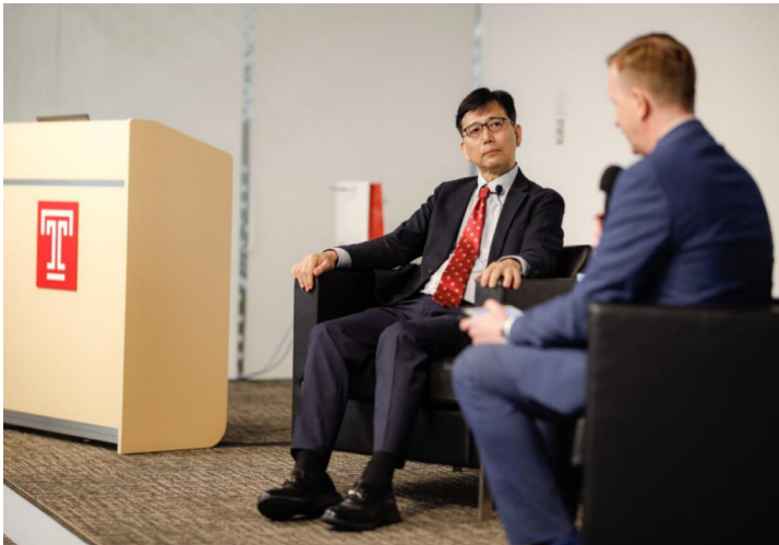
会場からの質疑に応じる四方敬之・内閣広報官(左)とTUJのウィルソン学長(右)

四方内閣広報官は、満席の参加者を前に講演を行い、対米関係やインド太平洋地域への関与についての岸田政権の政策、日本の安全保障やグローバルヘルス（国際保健）問題、経済成長、イノベーション、テクノロジーへのアプローチなどについて見解を述べました。また、日米同盟の重要性および東アジア・インド太平洋地域の安定の重要性を説明し、今年5月に行われたG7広島サミットにおける進展についても触れました。