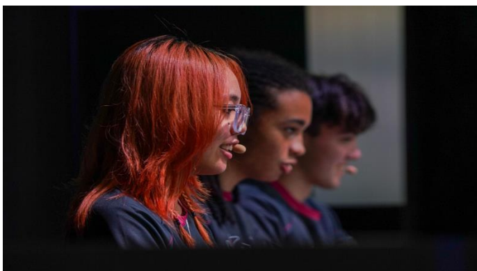
9月に開催された東京ゲームショウにTUJのeスポーツチームメンバーが参加。

TUJは2023年5月（夏学期）からeスポーツ修了証書プログラムを開講し、eスポーツ界におけるマネジメント、業界動向、法的・倫理的課題、ソーシャルメディア活用や収益獲得の手法などを学ぶコースを提供しています。それに伴って大学公式学生eスポーツチームも、組織化されました。学内の活発なゲーミングコミュニティ育成にも注力しています。