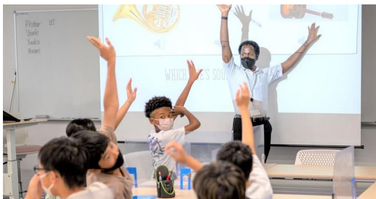
TUJ小学生の国内留学プログラム、昨年の授業風景

TUJは、毎年夏休みに小学生から大学生と幅広い年齢層向けにさまざまな短期集中英語プログラムを開催します。リピーターや兄弟姉妹での参加も多く、人気のプログラムです。合計1,000名以上の参加者が学んでいます。2023年も大盛況でした。世田谷区立小・中学生には参加費助成制度があります。