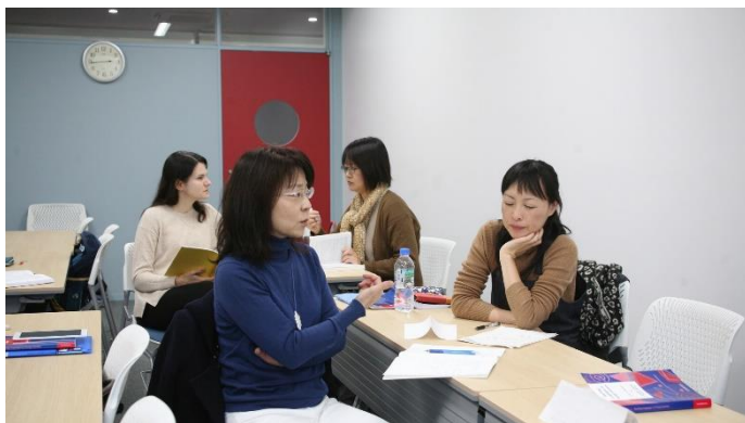
東京都世田谷区にあるキャンパスでの生涯教育プログラムの履修風景。

生涯教育プログラムは、時代のニーズと受講生の多彩な学習目的に応える、単位取得を目的としない公開講座を提供するプログラムです。