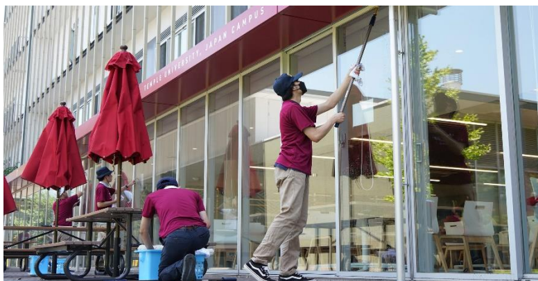
TUJを訪れ、作業学習として窓清掃の技術を習得する青鳥特別支援学校の生徒たち

2023年7月10日に青鳥特別支援学校の生徒たちがTUJを訪れ、カリキュラムの一部である作業学習との時間としてキャンパスの窓清掃を行いました。TUJはこの訪問を歓迎し、テンプル大学のロゴがプリントされたTシャツをプレゼント。生徒たちはそれを着用して熱心に作業にあたりました。キャンパスの美化はもちろん、多様な背景を持つ個人同士の交流と理解促進につながった活動でした。