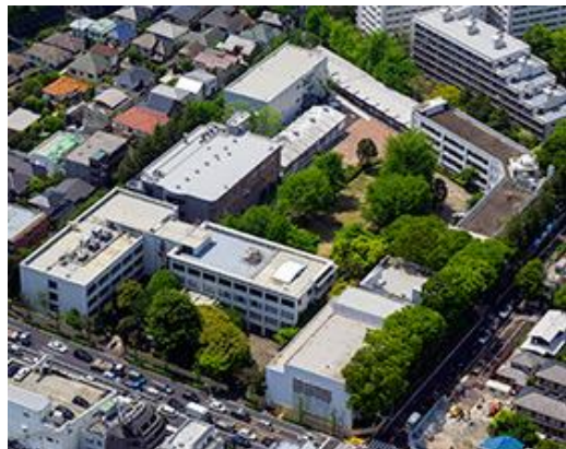
多摩美術大学 上野毛キャンパス