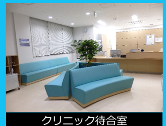
クリニック待合室