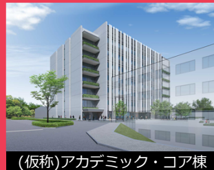
(仮称)アカデミック・コア棟

日本体育大学横浜・健志台キャンパスの学生寮、校舎、体育施設は建設以来42年が経過し老朽化が進んでいるため、令和5年4月より横浜市都市計画提案制度を活用して再開発整備を行っています。令和7年度までに地上7階の校舎のほか、地域住民の利用を視野に入れた防災広場や地域に開かれたキャンパスとして、健康促進や環境保全の意識を高めることを目的にトレイルルート（オフロードの散策路）を整備します。