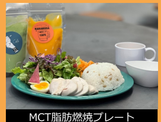
MCT脂肪燃焼プレート