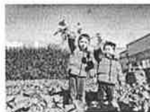
小松菜とったそー