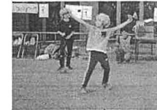
ダンス・歌・あやうい。 なんでもみんなの前できてみよう!