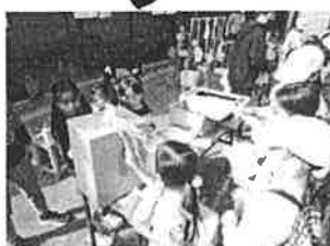
わりりの店。ゲームやさん。 じどうかんではあそびたせよう!