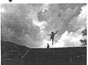
2泊3日キャンプへ。ボク4〜 7(あそびに) キャンプファイヤー!

中高生おやつ会議 27(土) ぜん 5:00 ~ 6:00 持ち寄ったあやつを食べながら、 じどうかんのでやりたいこと、ほしいものを話そう。 対象 → 新中学1年生 ~ もももの → おやつ