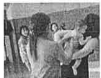
おんぶのコツ伝承中