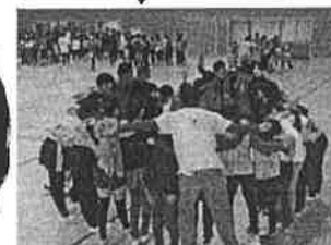
めだせ! 世田谷ナバー-1!! いんしゃうがさ 舞臺で、アツい!