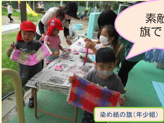
染め紙の旗(年少組)