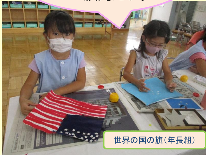
世界の国の旗(年長組)