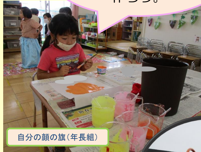
自分の顔の旗(年長組)