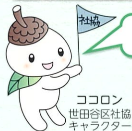
ココロン 世田谷区社協 キャラクター

社会福祉協議会は、誰もが地域で安心して住み続けられるよう住民の皆さまと共に、福祉のまちづくりを進めています。