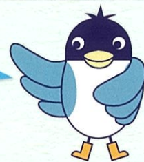
あんすこ君 あんしんすこやかセンター イメージキャラクター