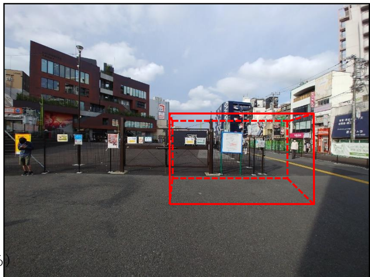
移設後イメージ (小田急改札より見る)