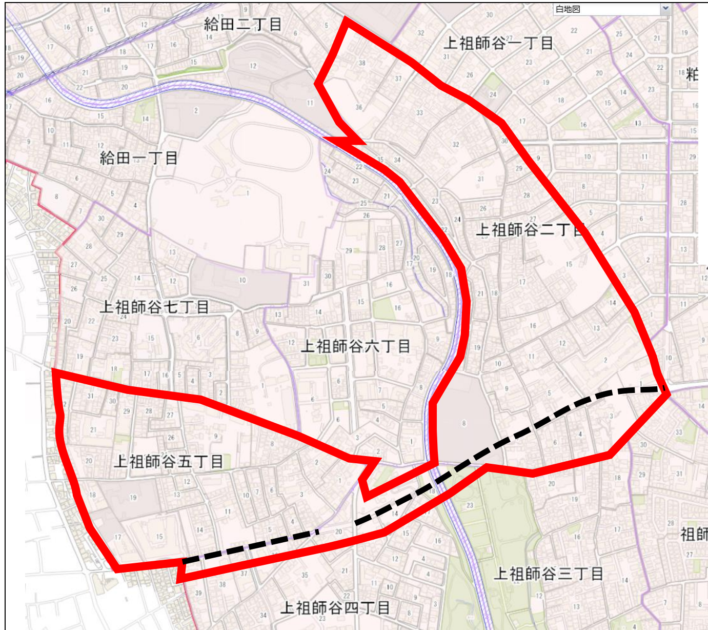
図-2 調査対象範囲図

上祖師谷二丁目および五丁目 ※令和3年度東京都防災都市づくり計画において、「木造密集地域ではないものの、防災性の向上が必要な地域」または「農地を有し、防災性の維持・向上を図るべき地域」に指定された区域